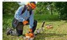
Foto: Starten der Motorsense

Im Weiteren bieten wir Kurse für Motorsensen an.